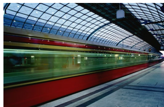
Abbildung 6: Wie Züge haben auch Texte eine optimale Länge.

So wie Fahrgäste eine ruhige Fahrt wünschen, so erwarten Leser eine gute sprachliche Aufbereitung. Wir bitten Sie daher auf die Rechtschreibung und klare, eindeutige Wortwahl