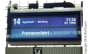
Abbildung 2: Der Fahrtrichtungsanzeiger klärt, wo die Reise hingehet.