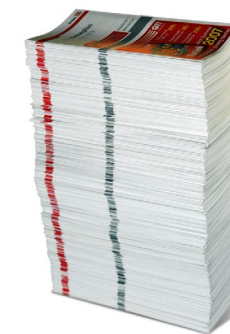
Abbildung 8: Wer weiter will, ist für Zusatzinformationen dankbar.

Genau wie Hersteller von Schienenfahrzeugen oder Schienenfahrzeugkomponenten ihre Produkte mit Herstellervermerken kennzeichnen, so müssen in Fachbeiträgen Informations- und Bildquellen genannt werden. Bei nicht von Ihnen selbst erstellten Abbildungen (Fotos, Grafiken etc.) liegt es in Ihrer Verantwortung, die Nutzungsrechte zu prüfen und den Copyright-Vermerk mitzuliefern.