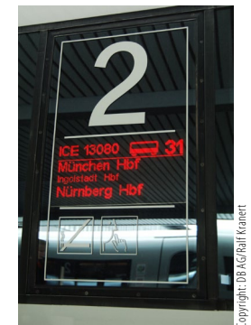
Abbildung 3: Einsteigen oder nicht? Dies beantwortet der Zuglaufanzeiger.