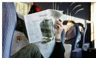
Abbildung 7: Ohne Störung bis ans Ziel.

zu achten. Mittels kurzer Sätze erleichtern Sie Ihren Lesern zudem das Verständnis.