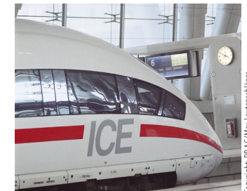
Abbildung 5: Große Wagenanschriften sind ein Blickfang.

Bitte stellen Sie daher Ihren Beitrag mit aussagekräftigen Abbildungen und Infografiken aus und verfassen Sie aussagekräftige Bildunterschriften, die das Interesse für den Beitrag wecken. Sollten Sie zudem einen Vorschlag für ein attraktives Aufmacherfoto haben, können Sie dies der Redaktion mitteilen. (Siehe dazu 3.1 und 4.5!)