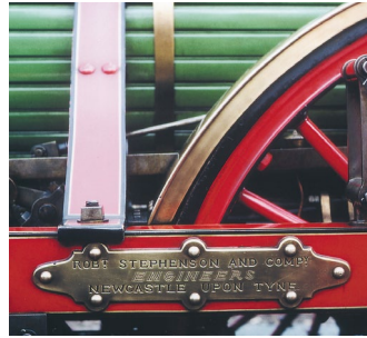
Abbildung 9: Typenschild des Herstellers.

Der Copyright-Vermerk nennt den Eigentümer der Bildrechte und unter Umständen auch den Urheber (Grafiker, Fotograf oder andere). In der „Mediathek der Deutschen Bahn“ finden Sie diese Angaben grundsätzlich in den Informationen zum Bild. Bei anderen Quellen müssen Sie den Copyright-Vermerk gegebenenfalls anfordern.