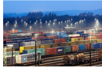
Abbildung 4: Nur mit Planung erreichen diese Wagons ihr Ziel.